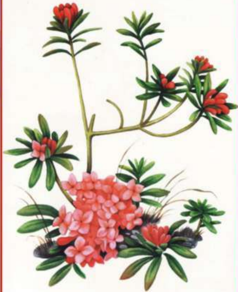
• Вовчі ягоди пахучі

Ця рослина охороняється в Русько-Полянському заказнику (Черкаська обл.) та на деяких інших територіях природно-заповідного фонду. Вирощується в ботанічних садах.