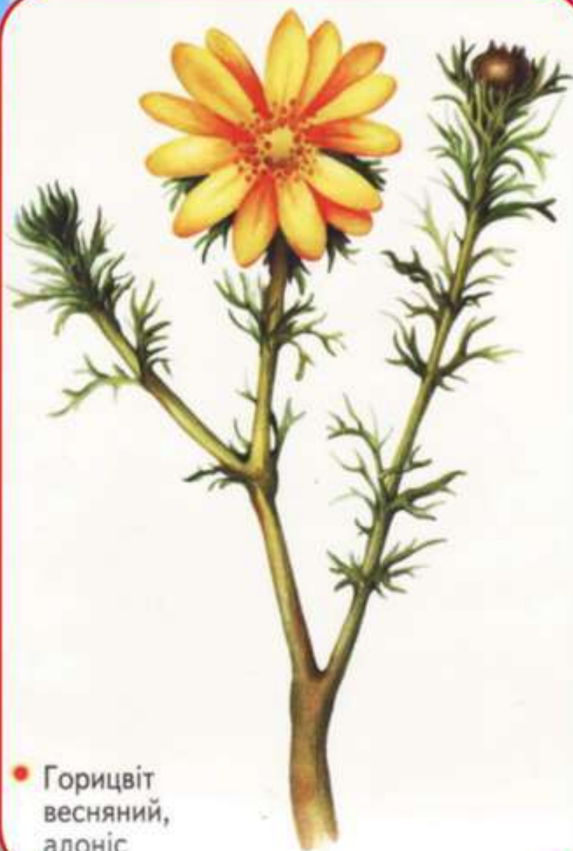
● Горицвіт весняний, адоніс

Горицвіт – важлива лікарська рослина, чудова декоративна рослина і гарний медонос. Поновлюється дуже поволі. З насіння розвивається протягом десяти і більше років! Потреба у сировині цієї лікарської рослини величезна, а природні запаси її, внаслідок надмірної заготівлі, значно зменшилися. Тому горицвіт розводять на спеціальних плантаціях.