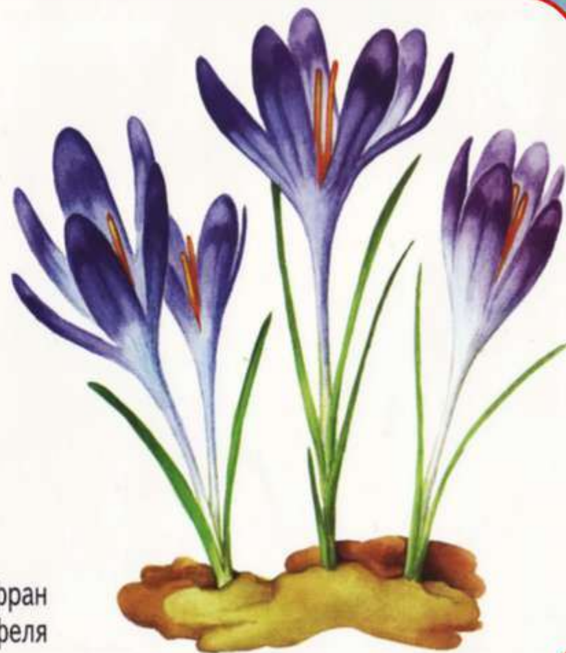
● Шафран Гейфеля

Зустрічається шафран у вологих листяних лісах, лісових галявинах, полонинах, на степових і кам'янистих схилах. Росте він у лісах, на узліссях, галявинах, по гірських луках, трав'янистих схилах у Карпатах. Значно рідше зустрічається ще в Хмельницькій та Тернопільській областях. Охороняється в Карпатському біосферному заповіднику; у природних заповідниках Розточчя, Медобори, Горгани і Канівський; у національних природних парках Карпатський, Синевир та Сколівські Бескиди; в деяких заказниках.